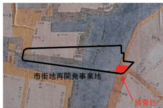
調査地推定位置図