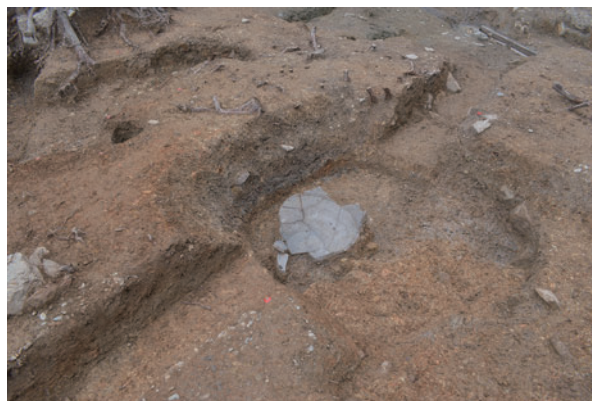
写真5 越前焼のかめを据えた穴（南から）