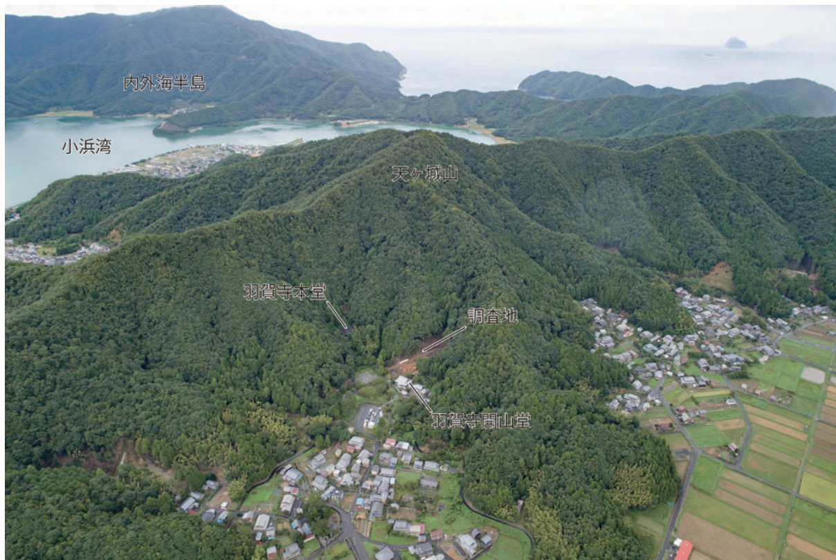
写真1 調査地遠景（南から）

この羽賀寺の一角で砂防工事が計画されたため、令和2年度から令和3年度にかけて、工事に先立ち発掘調査を行うこととなりました。今回報告するのはこのうち、令和2年度に行った調査の成果です。