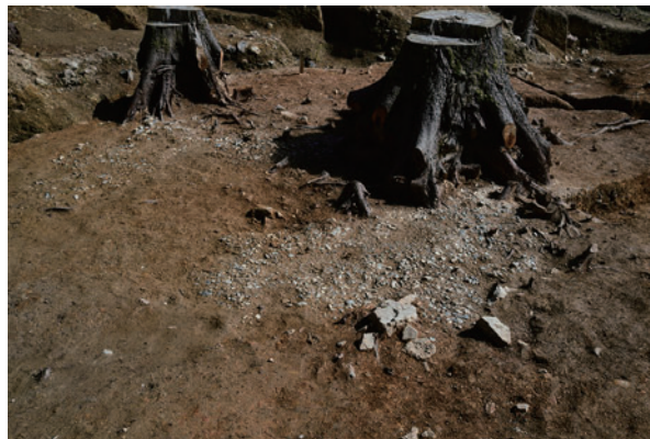
写真4 砂利敷き（北西から）