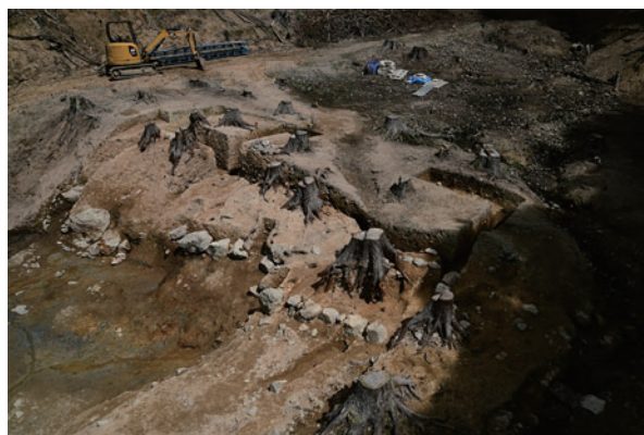
写真3 斜面の石の列（南から）