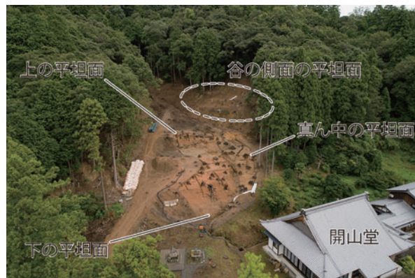
写真2 調査区全景（南西から）

まとめ 昨年度の調査では中世以降の石の列や砂利敷き、盛り土などの遺構や遺物が見つかり、谷を造成して利用していたことが分かりました。今年度の調査では、遺構の続きが見つかることが期待されます。（野路昌嗣）