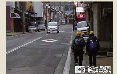
▲歩道がなく危険な通学路

自動車がバイパスを利用することで、現在の住宅地沿線の道路は交通量が減少し、歩行者・自転車は安心して利用することができます。