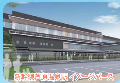
新幹線芦原温泉駅イメージパス