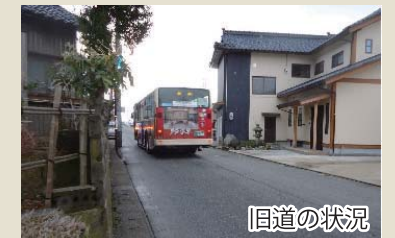
▲道路幅が狭く、すれ違いが困難

これまで道路幅が狭くまたは見通しが悪い所を通過していた自動車は、バイパスを快適に通行できます。