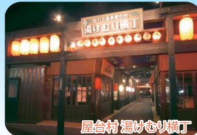
屋台村湯けむり横丁