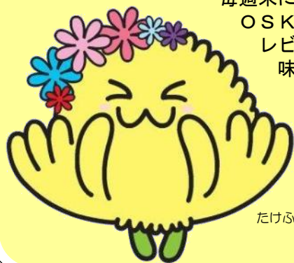
たけふ菊人形マスコットキャラクター きくりん

遊園地のアトラクション、 毎週末に開催されるイベント、 OSK日本歌劇団によるたけふ レビュー、ご当地グルメが 味わえるフードコートなど 他にもたくさん 見どころがあるリン♪