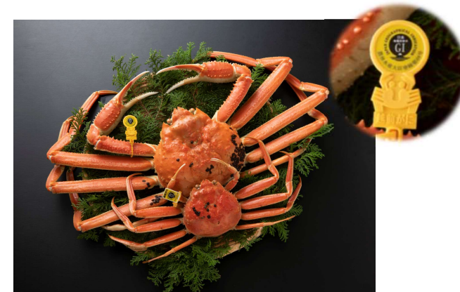
越前がに（右上：産地証明タグ）