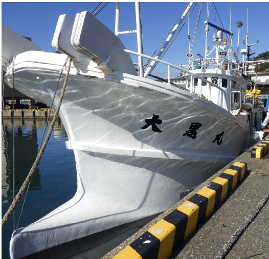
底曳網漁船「大黒丸」