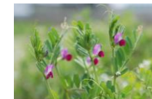
カラスノエンドウ