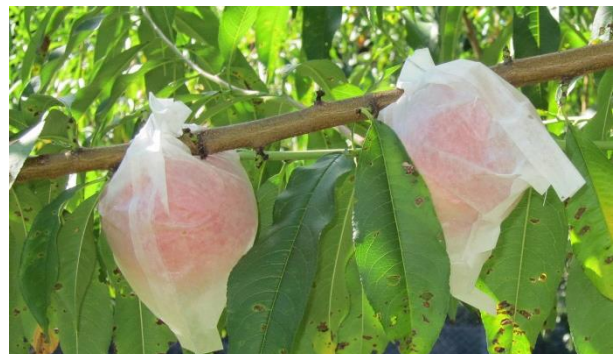
図2 モモの袋かけ栽培