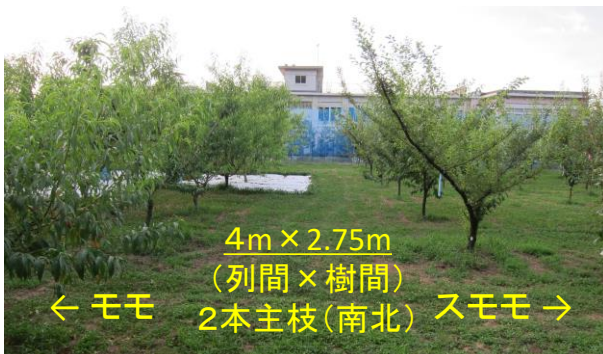
図1 モモ・スモモの栽培圃場