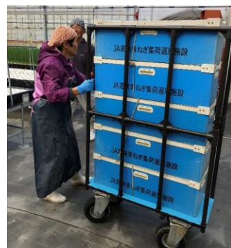
カート台車で無理なく運搬