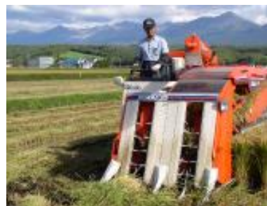
ピロール農法によるコシヒカリも生産しています