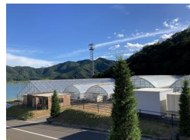
海を望む大型ハウスや露地でブドウやかんきつを栽培