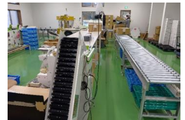
重労働軽減が図られた選果場