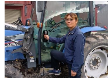
現場を支える仲野取締役