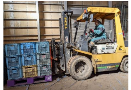
大型特殊、フォークリフト、天井クレーンの免許取得。