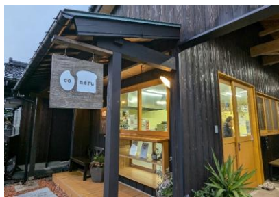
伝統的な町並みを残す熊川宿に佇む「米パン工房coneru」