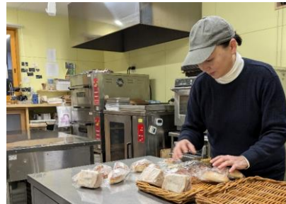
パン作り歴13年 地元保育園にも米粉パンを提供