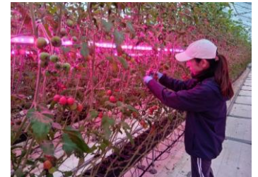
LEDが輝くハウスでトマトを生産