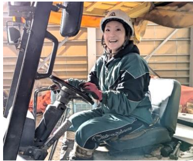
春は稲作オペレーターとして、大型の田植機、トラクターを操る