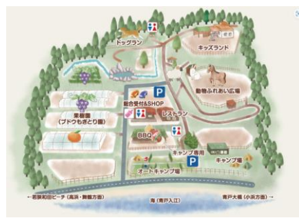
果樹園と隣接した複合施設「青戸バイサイドヒルズ」