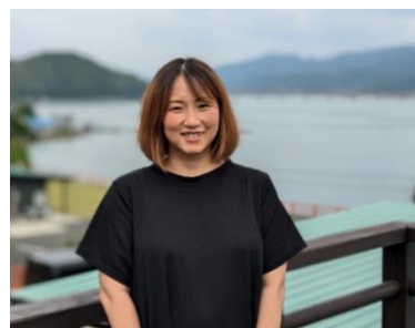
社長業と育児にまい進する西本代表