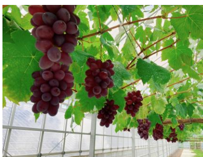
高品質でおいしいブドウづくりを目指す。品評会では金賞を獲得。