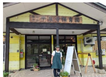
旧保育園の面影を残した「平泉寺のパン屋さん」。パン屋と洋菓子店の中間となるお店を目指す。