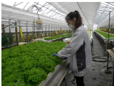
レタスやブロッコリーの収穫は早朝から行い、鮮度のよい状態で出荷