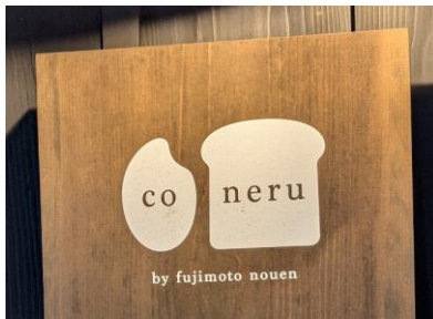
看板には米とパン、藤本農園の名前がデザインされている