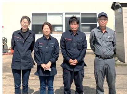
(右から)縫田組合長、加藤事務局長、小倉さん、加藤さん