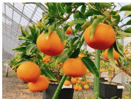
せとか、スイートスプリング、西郷瓢柑(ひょうかん)など多種のかんきつを栽培

品質のよいブドウやかんきつの生産販売に加え、2023年にブドウの観光農園を開始。お客様がおおい町に足を運び、楽しく過ごす場を提供したいと、農業と観光業との融合に取り組んでいます。