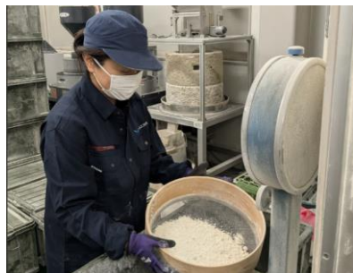
石臼10台を稼働し製粉。顧客に合わせてそば粉を調製、出荷