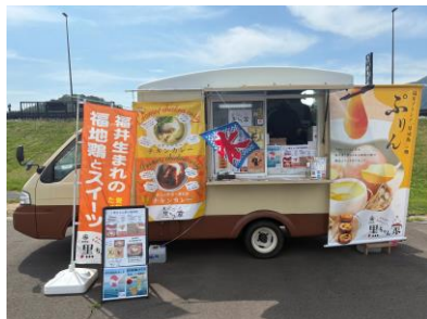
キッチンカーでイベント等に出店。 親子丼、プリン、エッグタルトが人気。