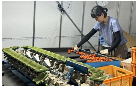
越のルビーの選別作業を皆で行うのがよいコミュニケーションになっている