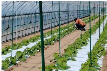
ハウス10棟と露地で約7品目を生産

経営面積：49a [施設栽培29a、露地栽培20a] 品目：越のルビー、スイカ、小玉スイカ、アールスメロン、マルセイユメロン、露地スイカ、コカブ