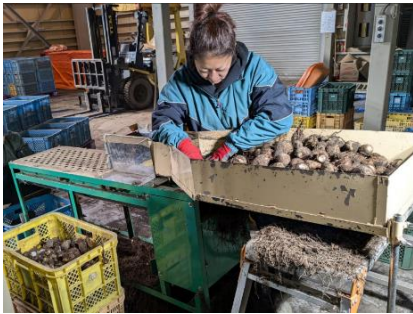
2年目に園芸係長に任命され、園芸部門を統括