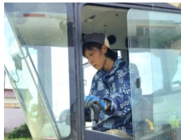
「もっと良くなる」という前向きな気持ちを原動力に取り組む