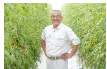
女性の力を引き出す木子社長