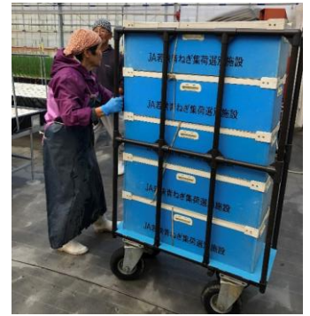
カート台車で無理なく運搬