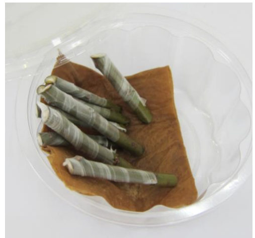
写真 調製した穂木

切接ぎを成功させるポイントは、①穂木を乾燥させずに低温で保存しておく、②樹液の流動が始まった時期に接ぐ、③穂木・台木ともに接着面が平滑になるように、穂木・台木を調製する、④穂木・台木の形成層(樹皮直下の養水分の通り道)がお互いに密着するように固定することである。