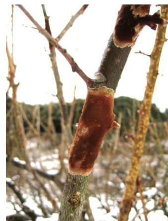
写真1 褐色こややく病

なお、石灰硫黄合剤・マシン油乳剤・ボルドー剤の混用はできない。石灰硫黄合剤とマシン油乳剤は交互（隔年）散布を原則とする。同じシーズンに散布する場合はマシン油乳剤と石灰硫黄合剤とは1か月以上の間隔をあける。また、石灰硫黄合剤とボルドー剤とは2週間以上の期間をあけて散布する。