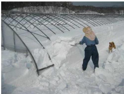
ハウスを覆うぐらいの積雪があった場合、肩部から除雪を始める。

被覆資材を除去してあるパイプハウスでは、パイプ交点等に積もった雪が着雪し屋根一面に積雪するので、時々人力で雪を落としておく。また、ハウス肩部や腰部のパイプ等が積雪に埋没したままにしておくと、沈降圧によって変形、破損等の原因になるので、早めに掘り出しておく。