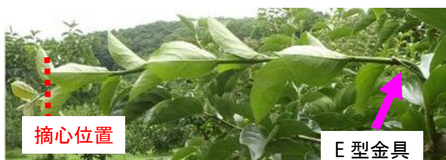
写真2 E型金具による徒長枝の側枝化