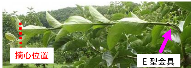
写真2 E型金具による徒長枝の側枝化