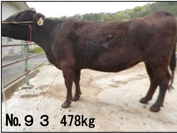
No. 9 3 478kg