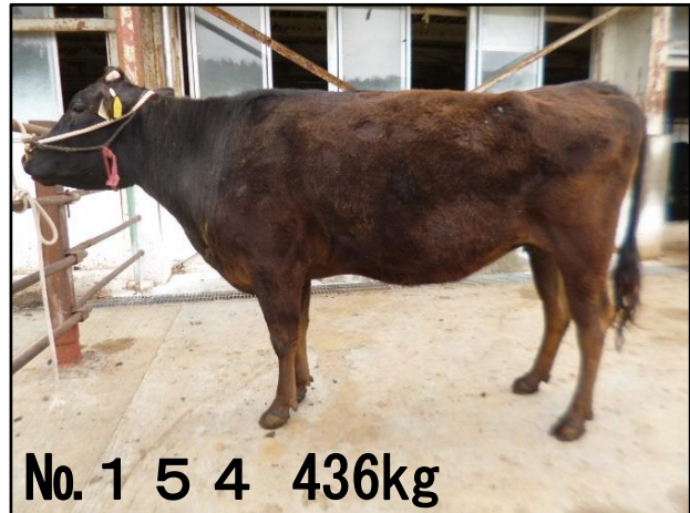
No. 1 5 4 436kg