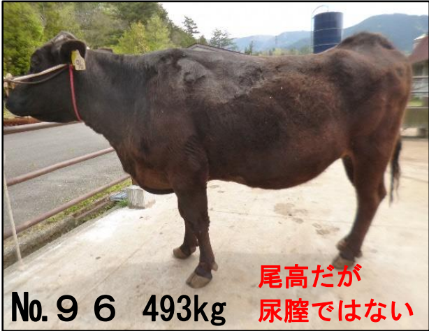
No. 9 6 493kg