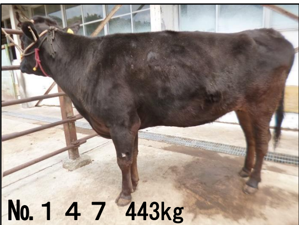
No. 1 4 7 443kg