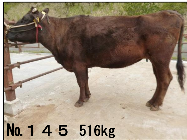
No. 1 4 5 516kg