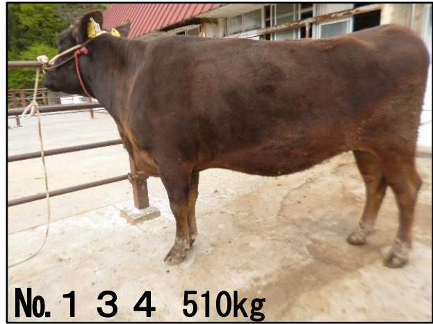
No. 1 3 4 510kg