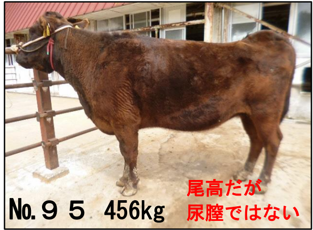
No. 9 5 456kg