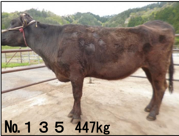
No. 1 3 5 447kg