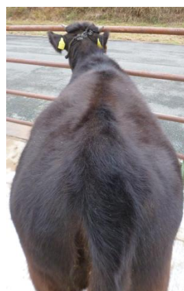
No. 124 安福久 — 百合茂 — 金幸