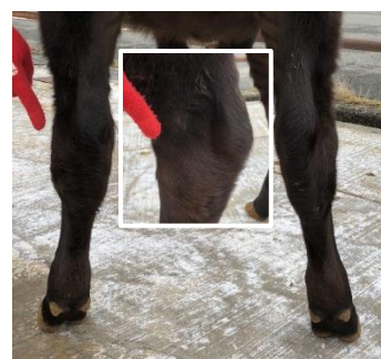
【No. 84 の治療経過および現状】

左後肢飛節部外側が腫脹したため、9/19に切開治療した。現在は治癒しているが、左右を比べると若干腫れが残っている。なお、歩様は当初から正常であった。