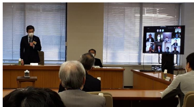
閉会挨拶（吉川部長）