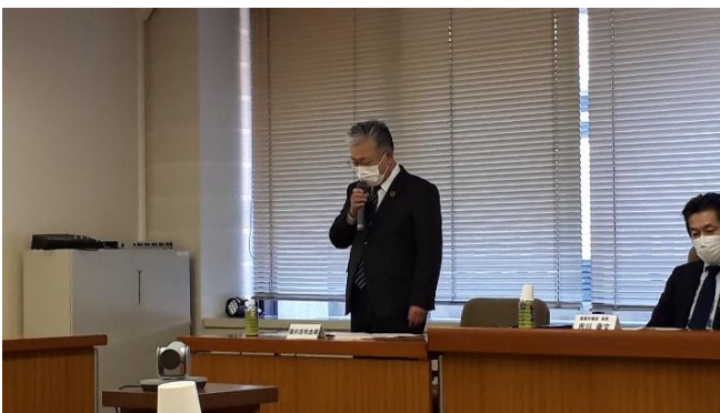
参加機関挨拶（福井信用金庫）