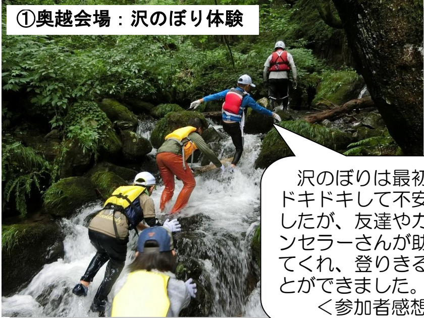
①奥越会場：沢のぼり体験

沢のぼりは最初はドキドキして不安でしたが、友達やカウンセラーさんが助けてくれ、登りきることができました。 <参加者感想>