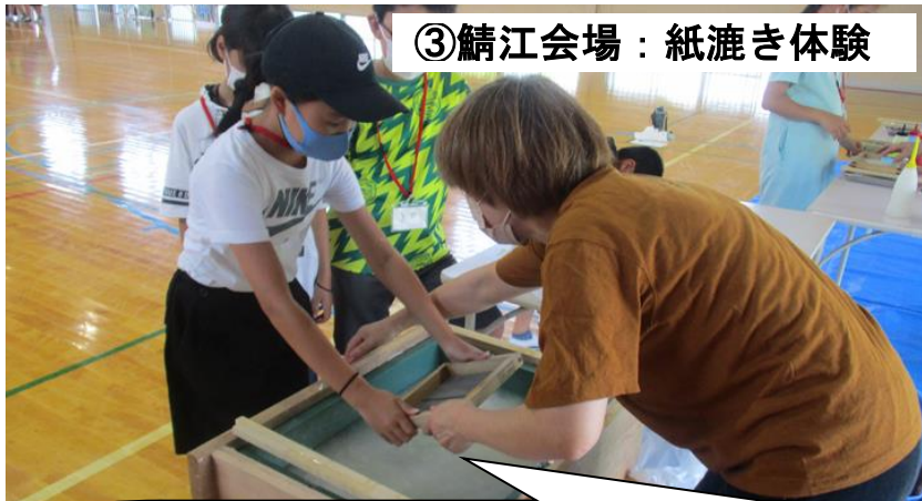
③鯖江会場：紙漉き体験

鯖江ならではの「伝統工芸」を体験してみませんか? 「流しそうめん」をしたりして、いっしょに夏を満喫しましょう!