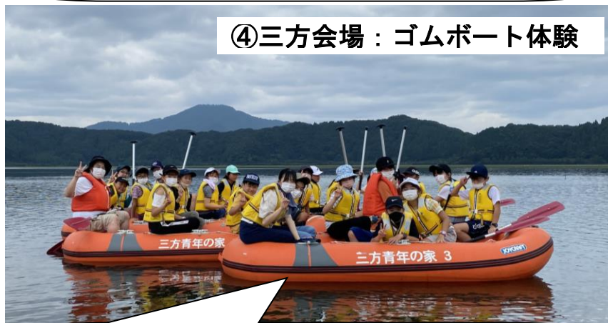
④三方会場：ゴムボート体験

みんなで力を合わせてボートで三方湖へ! ミカタの風をいっしょに感じてみましょう!