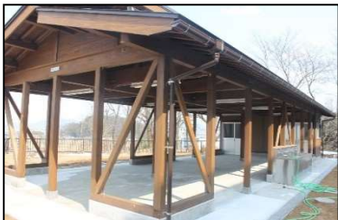
かみおかキッチン