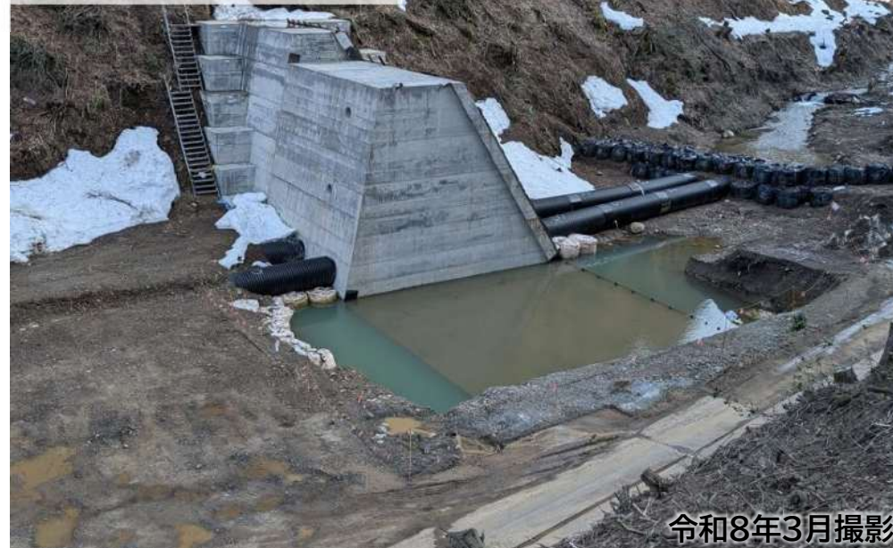
七重谷川砂防堰堤 [大桐地区]