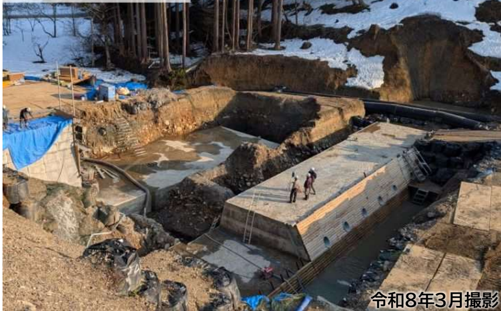
鹿蒜川砂防堰堤 [大桐地区]