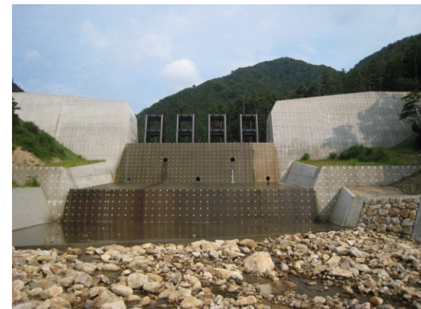
透過型ダム(嵩上げ、部分スリット化)に改良