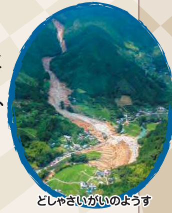
どしゃさいがいのようす

これまでの入賞作品は国土交通省砂防部Webサイトで見ることができます。 https://www.mlit.go.jp/mizukokudo/sabo/kaiga_sakubun.html