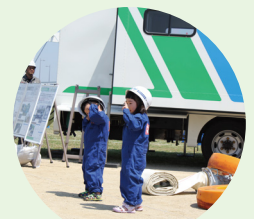
テックフォース子供体験