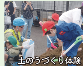
土のうづくり体験