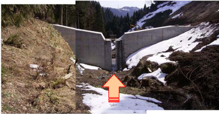
平成16年3月 土石流発生前

平成16年7月18日5:00～12:00にかけて、当該地区では梅雨前線に伴う集中豪雨(最大時間雨量85mm)により、土石流が発生しました。しかし砂防えん堤により土砂を捕捉し、下流域での人的・家屋被害はありませんでした。