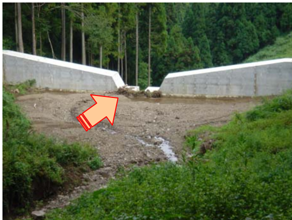
平成16年8月 土石流発生後