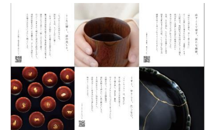
リーフレット作成