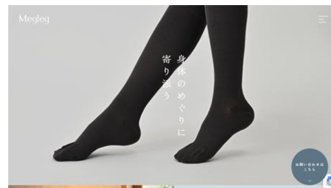
商品の専用Webページ