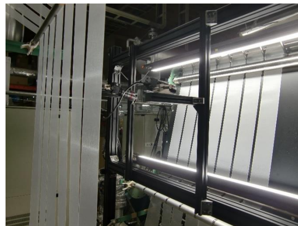
カメラが検品を行う様子