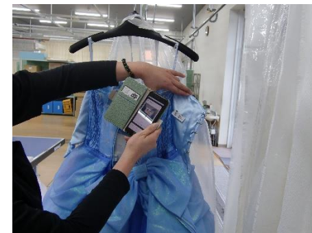
QRコードの読み取りで一連の業務を一元管理