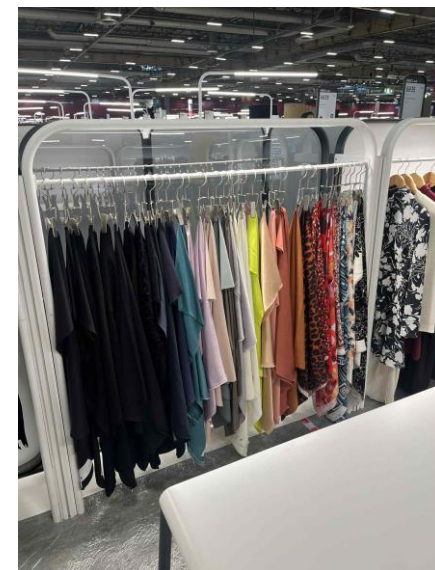
Premiere Vision Paris 2025 9月展