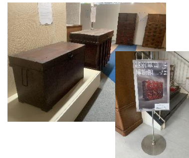
店舗を資料館に改修