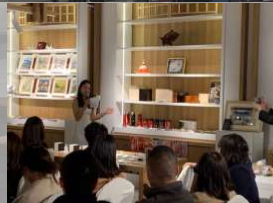
2021年に開催した福井県フェアの様子