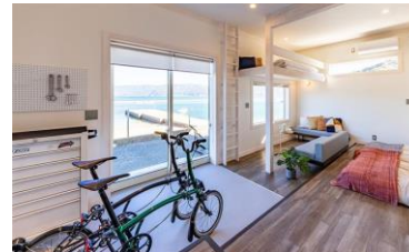
サイクリストに優しい宿

食や歴史、映える夕日など嶺南地域のブランド力を向上させる「若狭湾プレミアムリゾート構想」や観光投資促進コーディネーターの配置による民間投資の促進やインフルエンサーによる情報発信等により、魅力向上と集客力の強化を図ります。また、観光資源を活かしたコンセプトルームの改修など、来県目的となるような多様かつ魅力的な宿泊施設の整備をさらに進めます。