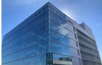
まちなかキャンパスを整備するアオッサ（外観）

県立大学において地域のリーダーを育成する地域政策学部（仮称）の開設を目指すとともに、「福井まちなかキャンパス」の整備を進めます。