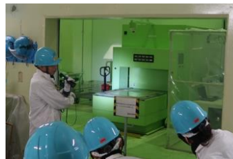
原子力サイクルビジネスイメージ

県・嶺南市町・民間の出資により、廃炉等で発生するクリアランス推定物を集中処理する新会社を設立します。本事業を通じて地元企業の参入に向けた人材育成を行うことで、従来二次下請以下であった地元企業が元請に近い立場で業務を受注できる産業構造を構築します。