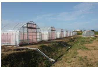
第2園芸カレッジのイメージ

嶺南地域における園芸の生産振興や新規就農者の育成・定着促進に向け、研修、観光・体験、研究施設が隣接する園芸拠点として「第二ふくい園芸カレッジ」の整備、「園芸LABOの丘」の機能を強化します。また、売上が1億円を超える経営体の育成のため、経営プランの策定やプランの実行にかかる取り組みを支援し、次世代の担い手の育成を推進します。