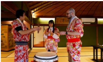
外国人向けコンテンツの充実

県庁内に「インバウンド交流課」を設置し、外国人の誘客や宿泊をさらに推進します。また、外部専門家による現状の調査・分析を行い、助言を政策立案に活かしていくとともに、海外のオンライン旅行会社のウェブページにおける特集記事掲載やJRと連携したプロモーションの実施など、世界に向けて観光コンテンツを発信します。