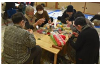
高齢者によるグループ活動イメージ

若者と応援者をつなぐマッチングイベントの開催など若者が変化や失敗を恐れずチャレンジできるよう、学びの場と活動発表の場を提供し、活動の活性化と育成を応援します。また、地域のシニアグループの立ち上げや継続した活動など高齢者の居場所づくり、生きがいづくりを支援し、全世代のチャレンジと活躍を応援します。