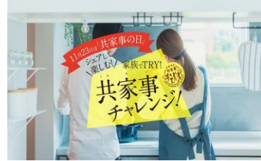
共家事チャレンジ

夫婦・家族で家事をシェアする「共家事」や家事の省力化・外部化による「ラク家事」を促進し、「ゆとり時間」を創出するための広報や参加型イベントを開催します。また、県内製造業者が行う女性が働きやすい職場環境づくりや企業の魅力発信をはじめ、女性管理職の登用や男性育休の取得促進など女性活躍を推進する企業の取組みを支援します。