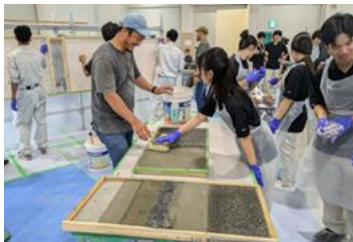
専門工事業体体験PR会

医療、産業、教育など各業界での人材確保が大きな課題となる中、看護師養成施設の学生確保や介護・障がい福祉事業所の職場環境改善、農林水産業や建設産業の担い手確保、交通機関等の運転士の待遇改善、教職魅力発信ディレクターの配置による教職の魅力発信をはじめとする様々な取り組みを支援し、各業界の人手確保に努めます。