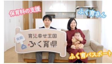
ふく育県イメージ

子育て世帯をサポートする「ふく育さん」や「ふく育タクシー」の一層の利便性向上のため、民間団体等への助成を拡充し、利用者負担の軽減を図るとともに、ひとり親世帯、多胎児、医療的ケア児等がいる家庭など育児負担が大きい世帯を対象とした共通利用券を発行します。また、福井県の充実した子育て環境や支援のPRを行い「ふく育」ブランドの定着を図ります。