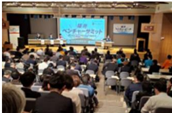
福井ベンチャーサミット

賃金が高く若者や高度人材が魅力を感じる研究開発型企業などの高付加価値企業を県内に集積させるため、成長が見込まれる企業の投資を支援します。