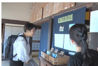
文化芸術活動の助言等を行う様子

文化芸術に関する相談や文化団体の活動に対する助言をはじめ、新たな文化創造や人材育成を行うため、「ふくい文化創造センター」を開設し、誰もが文化芸術を楽しめる環境づくりを行います。また、担い手不足により保存・継承が危惧される地域の伝統行事の活性化への支援や美術館や博物館の機能強化に向けた基本計画の策定を行います。