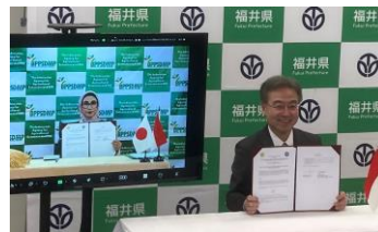
インドネシア農業省との覚書締結

各業界の人手不足克服に向け、海外政府機関との人材交流等の連携や外国人材の受け入れを行う企業の環境整備、研修会の実施を支援します。また、相談から解決までの支援を行う「総合支援コーディネーター」の配置や外国人コミュニティリーダー等を通じた情報発信など「ふくい外国人相談センター」の機能強化を図り、外国人も暮らしやすい福井を実現します。