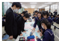
高志中学校での 「現場でトーク」の 様子

職員が学校や企業などを訪問し、 長期ビジョンを紹介。県民の皆さま と一緒にふくいの未来を考えるワー クショップも併せて行っています！