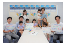
子育て世代の 「FUKUI未来トーク」 の様子

県民の皆さまが主体となって、ふくいの 将来像実現に向けて、自分に何がで きるか「私のアクション」について語る ワークショップのサポートをしています。