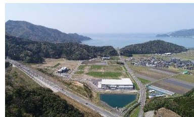
敦賀市や美浜町等における新たな産業団地の整備 (若狭美浜IC産業団地)