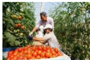
ふくい園芸カレッジでの就農研修の実施