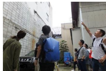
地域づくり活動に参加する都市在住者を誘致