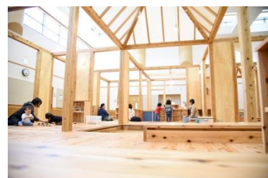
子どもが遊ぶ様子を見ながら気軽に相談できるワンストップ窓口の整備