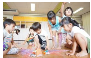
市町と協力して一時預かり等の保育サービスを拡充