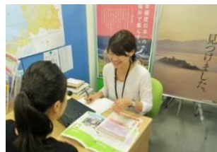
Uターン就活先輩等が学生に福井の企業を紹介