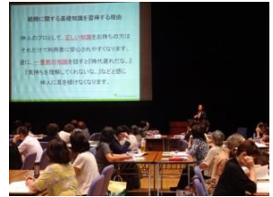
「ふくい縁結び学校」を開催し、結婚相談の知識を習得