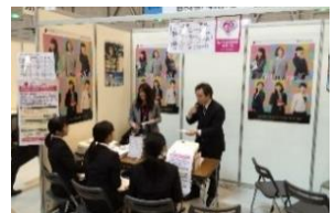
合同企業説明会において女性活躍推進企業をPR