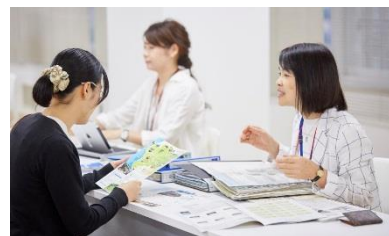
福井Uターンセンターにて移住希望者への相談・情報提供を実施