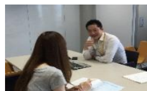
創業マネージャーによる伴走型支援サポート