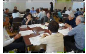
縁結びさん同士の交流会や相談会等を開催