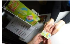
「すまいるFカード」提示者に特典サービスを提供