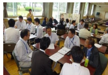
「職場の縁結びさん」が結婚支援を学ぶ研修会