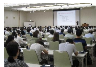
企業の人材確保策に関するセミナーや相談会等を開催