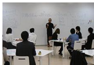
県内企業の経営者や社員と県内大学生との交流会