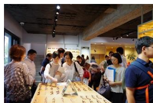
優れた県内企業を訪問する保護者向けバスツアーを開催