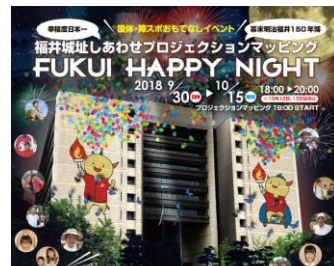
総合月刊誌の特集掲載、プロジェクションマッピング