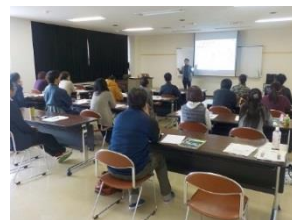
農業ビジネスセンターでの里山里海湖ビジネス研修