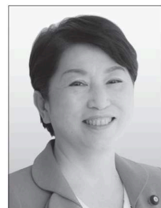
社民党党首 福島みずほ