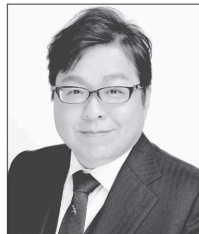
さくらい まこと 党首 桜井 誠