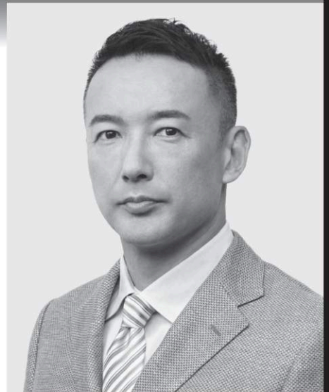
れいわ新選組 代表