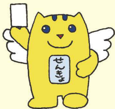
明るい選挙のイメージキャラクター 「選挙のめいすいくん」

平成24年 募集開始 5/7 月 締め切り 9/7 金 ※市区町村によって異なりますので、詳しくは最寄りの 選挙管理委員会にお尋ねください 発表 11 月