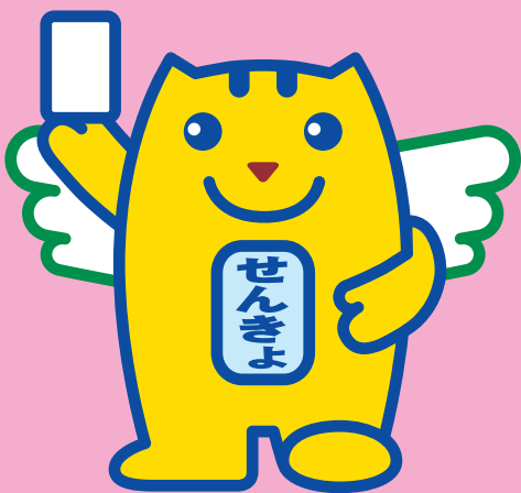
明るい選挙のイメージキャラクター “選挙のめいすいくん”