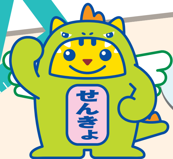
めいすいサウルス (福井県ご当地めいすいくん)

みんなが投票に行きたくなるような キャッチフレーズや標語を募集するよ。 たくさん応募してね!