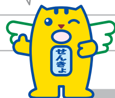
選挙のめいすいくん (明るい選挙のイメージキャラクター)

日本の未来を担う若い世代の声をより政治に取り入れるため、70年ぶりに法律が改正されて、平成28年7月に行われた参議院議員通常選挙から選挙権年齢が18歳以上に引き下げられました!!