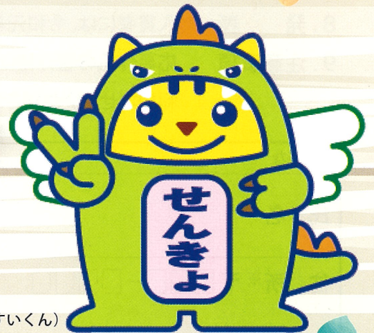
めいすいサウルス (福井県ご当地めいすいくん)

みんなが投票に行きたくなるような キャッチフレーズや標語を募集するよ。 たくさん応募してね！