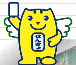
選挙のめいすいくん (明るい選挙のイメージキャラクター)

日本の未来を担う若い世代の声をより政治に取り入れるため、70年ぶりに法律が改正されて、平成28年7月に行われた参議院議員通常選挙から選挙権年齢が18歳以上に引き下げられました！！