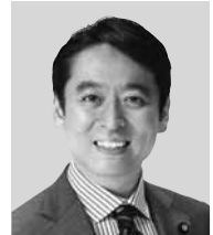
ひらき 平木 だいさく 現 役職：元経済産業大臣政務官。 参院議員1期。 経歴：東京大学文学部卒。 年齢：44歳