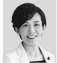
やまもと 山本 かなえ 現 役職：元厚生労働副大臣。 参院議員3期。 経歴：京都大学文学部卒。 年齢：48歳