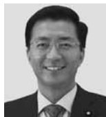
党副委員長 山下 よしき 現 59歳。参院議員3期。 活動地域 大阪、兵庫、滋賀、奈良、和歌山