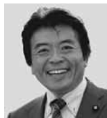
弁護士 仁比 そうへい 現 55歳。参院議員2期。党参院国対副委員長。 活動地域 中国、四国、九州、沖縄