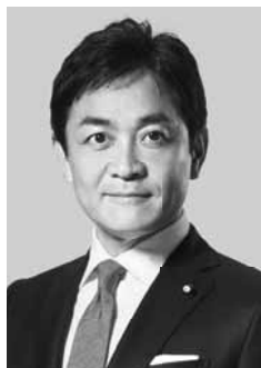
国民民主党 代表 玉木雄一郎