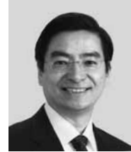
やまもと 山本 ひろし 現 役職：元財務大臣政務官。 参院議員2期。 経歴：慶應義塾大学法学部卒。 年齢：64歳