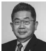
党書記局長 小池 晃 現 59歳。参院議員3期。全国革新代表世話人。医師。 活動地域 東京