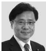
党参院幹事長・国対委員長 井上 さとし 現 61歳。参院議員3期。 活動地域 東海、北陸信越、京都