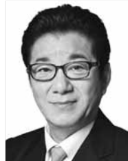
代表 松井 一郎