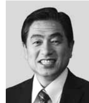
わかまつ 若松 かねしげ 現 役職：元復興大臣、参院議員1期。 経歴：中央大学二部卒、公認会計士。 税理士、行政書士。 年齢：63歳