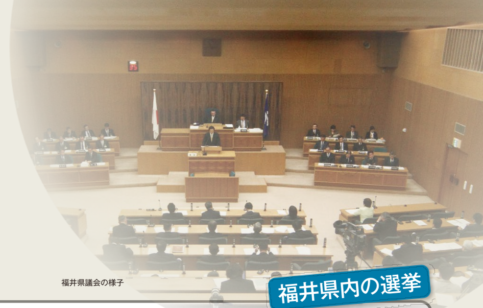
福井県議会の様子

一概に選挙と言っても、対象となる選挙にあわせてその制度もいろいろ。国の選挙(衆議院議員、参議院議員)と福井県内の選挙(県知事、県議会議員、市町長、市町議会議員)に分けて、その仕組みを見ていこう。