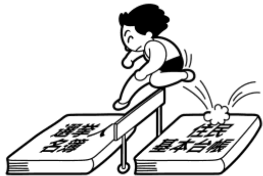
住民基本台帳に登録されなければ 選挙人名簿に登録されない