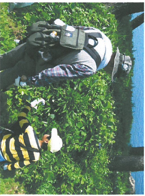
標本作り：雄島公民館