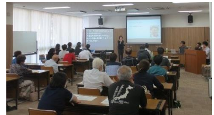
タウンミーティングの様子