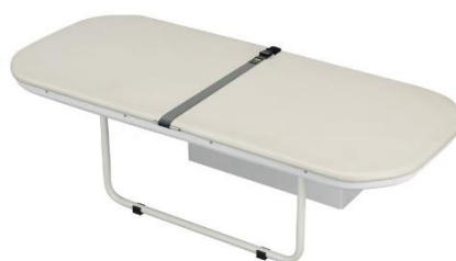
ユニバーサルシート