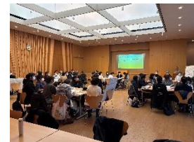
権利擁護・虐待防止研修の様子