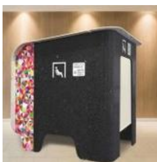
カームダウンスペース