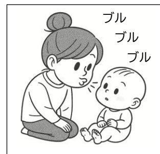
【くちびるブルブル】

親御さんの声が「口」から出ていることに気づきます。口を見せながら楽しく遊びましょう。