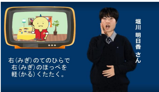
③おいしい おいしい