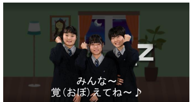
みんな おぼえてね♪