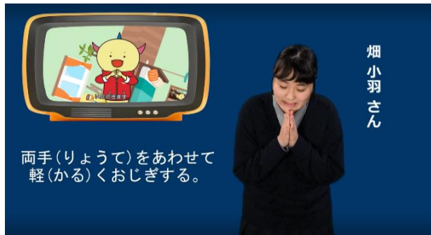
②いただきます いただきます