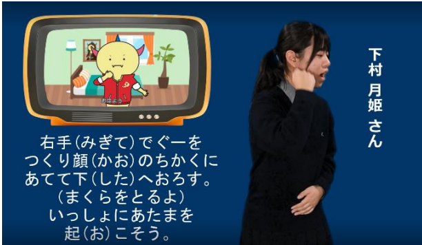
①おはよう おはよう