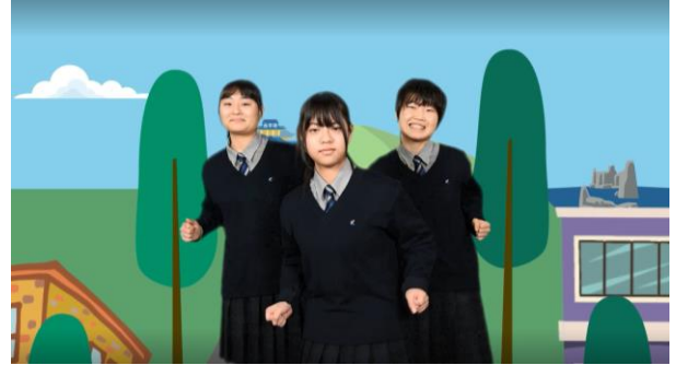
②9 ♪かんそう ♪すきなふりつけをつけてね