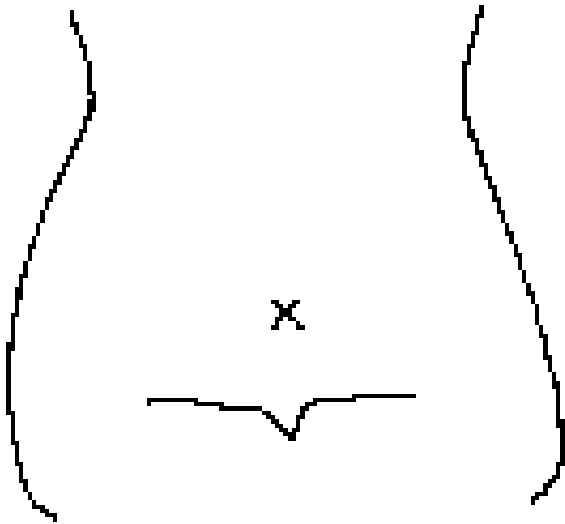
(ストマおよびびらんの部位等を図示)