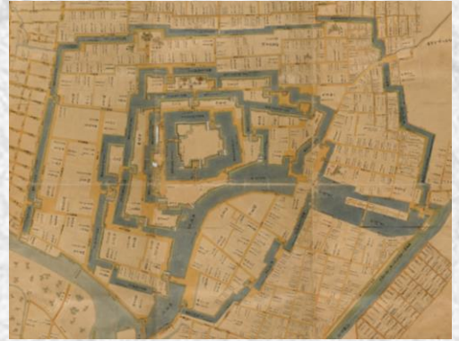
「福居御城下絵図」 (松平文庫 福井県文書館保管)

明治以降、櫓や城門は取り壊され、四重五重の水堀も徐々に埋められましたが、本丸の石垣と内堀は400年以上たった今も現存しています。