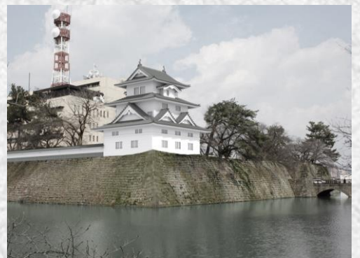
坤櫓・西側土堀の復元予想図

坤櫓は、当時の規模を再現し、高さ約16mで復元する計画です。復元後は福井駅から見えるようになります。