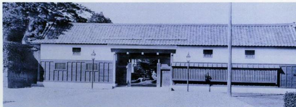
松平邸長屋門「越山若水」(明治42年)