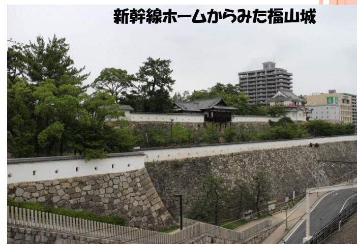
新幹線ホームからみた福山城