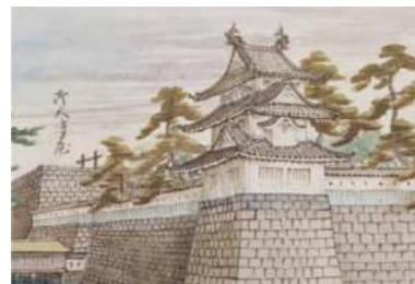
坤櫓（絵図 福井温故帖 越後文庫） （福井市立郷土歴史博物館保管）