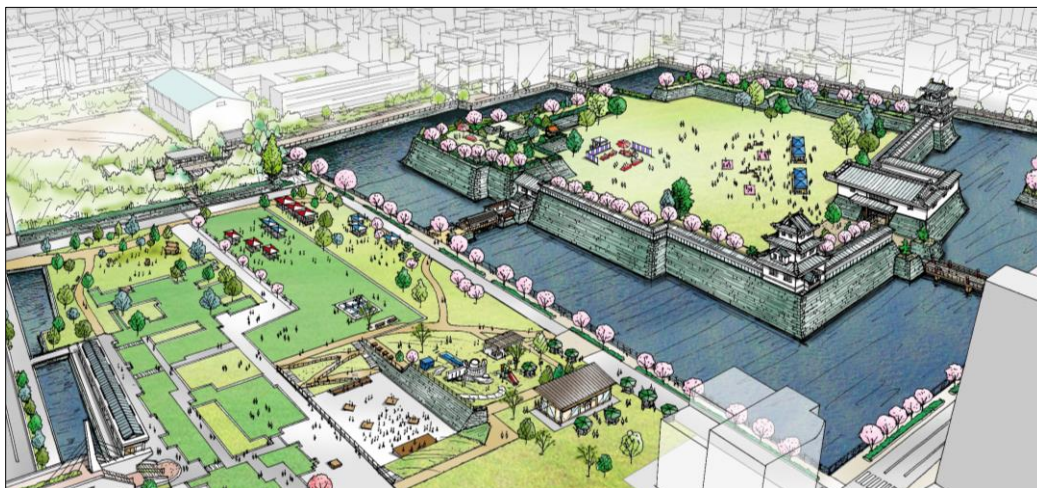
(将来) 県庁舎等移転後の活用イメージの一例