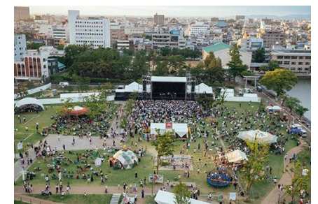
ワンパークフェスティバル（中央公園）