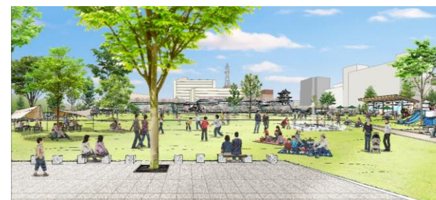
中央公園の利活用のイメージ