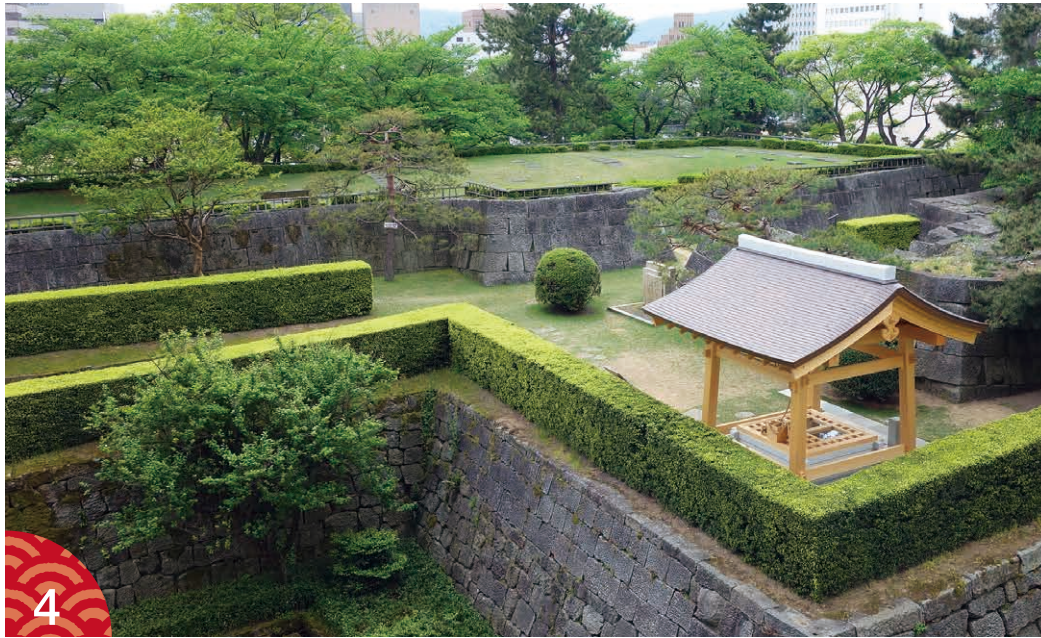
福井城天守台にある井戸「福の井」