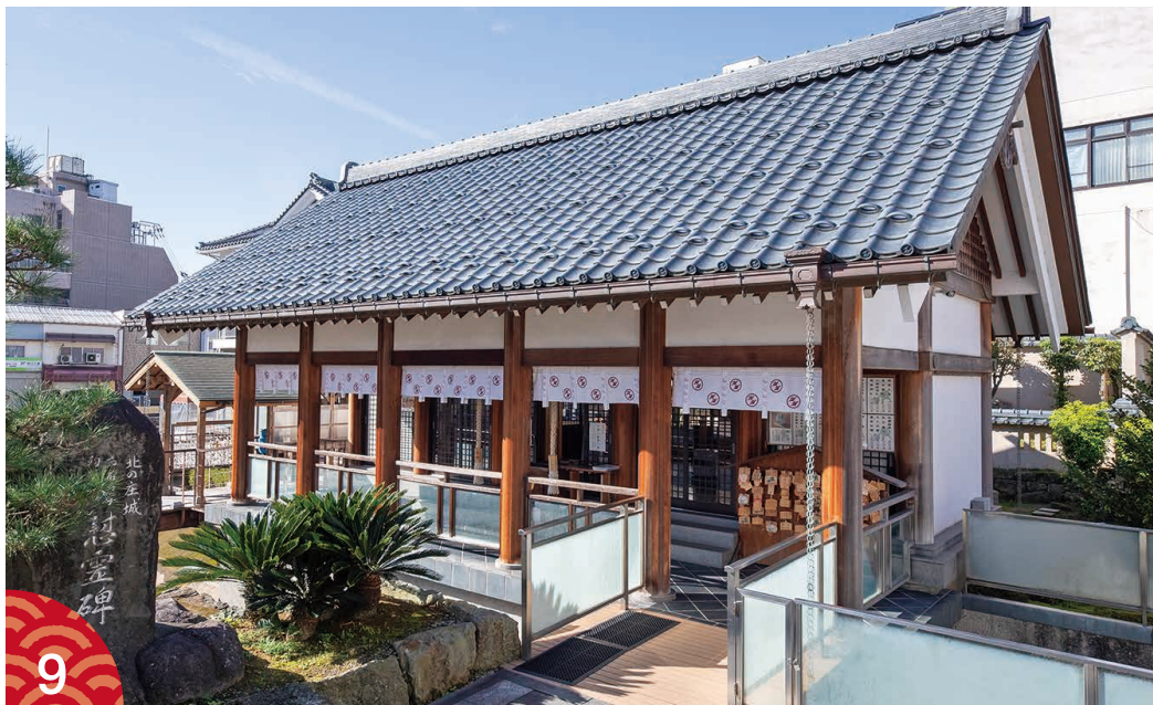
北庄城のあった場所に鎮座している柴田神社