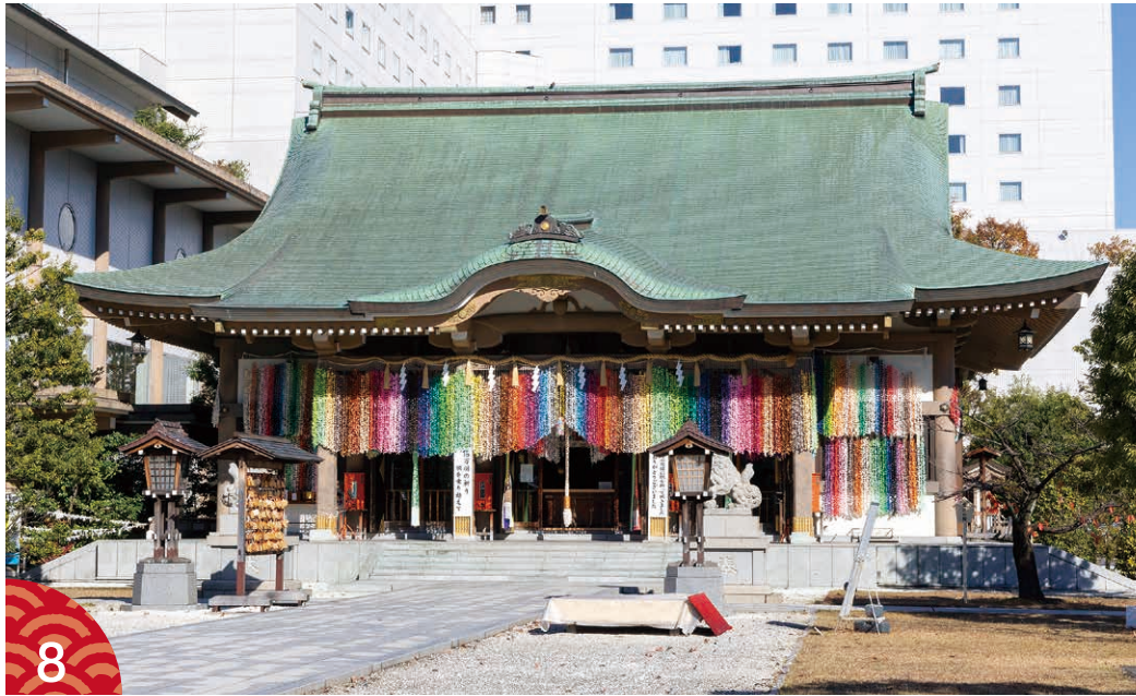
ごんげんづく 壮麗な権現造りの佐佳枝廼社拝殿