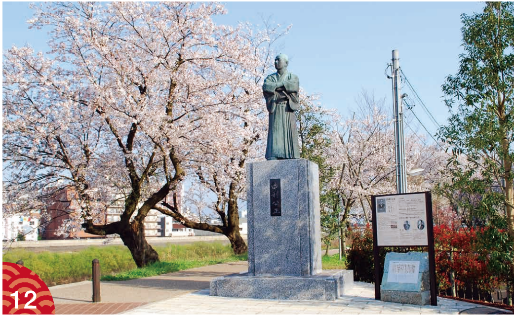
居宅跡に近い幸橋南詰の広場に建つ由利公正像