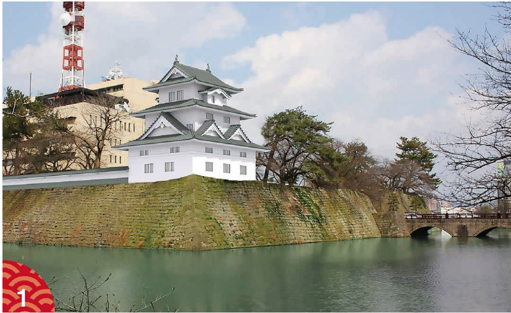
復元イメージ(令和11年度完成予定)