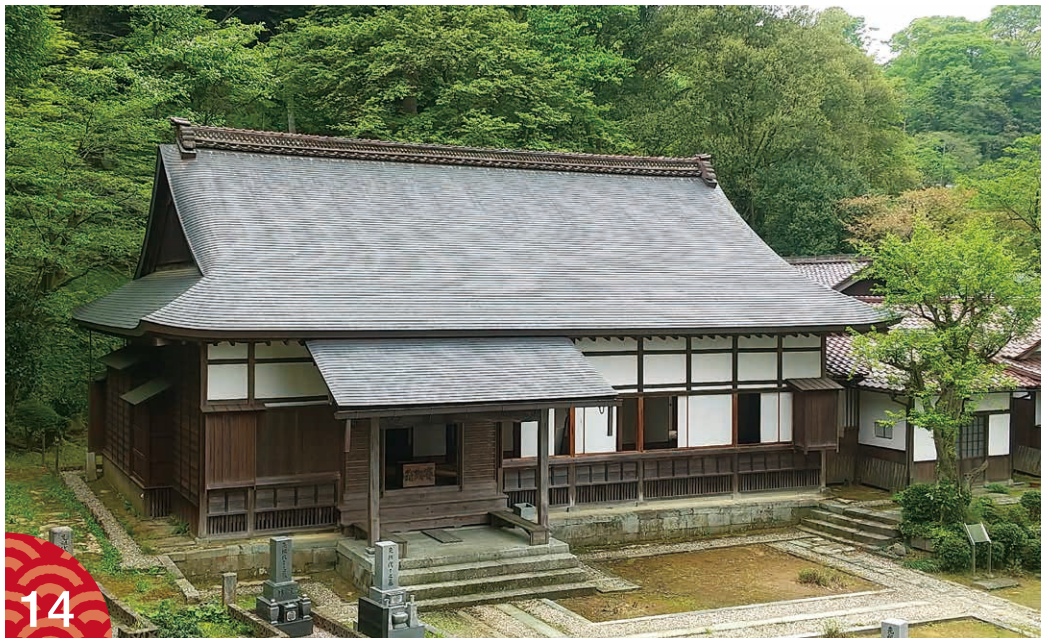
福井城本丸御殿の建物を移築した瑞源寺の本堂