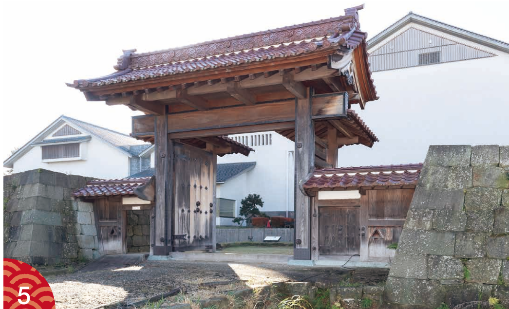
福井城の北側の外堀に設けられ、防備を固めていた舎人門