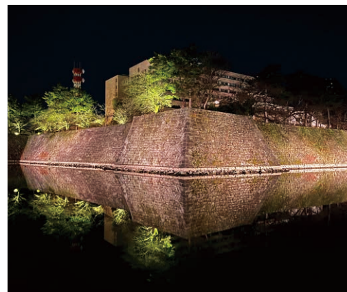
※毎日、日没から22時まで点灯