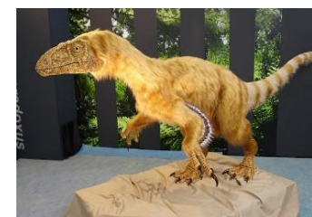
モニュメント（イメージ）