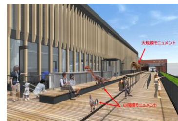
観光交流センター屋上（イメージ）