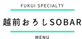
SOBARメニュー・SOBARロゴ（イメージ）