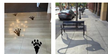
恐竜足跡・影ペイント（イメージ）