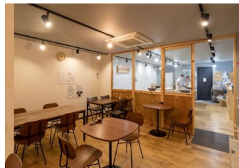
店舗(案)：越前蕎麦倶楽部

地域のそば名店やそば打ち名人・そば愛好グループが交代でSOBARメニューを提供する店舗や、観光客がそば打ち体験できる店舗を開設