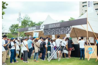
イベント出店（イメージ）

SOBARメニューを提供するコンセプトショップ（仮設店舗ブース）をイベント出店し、SOBARスタイルをPR・発信