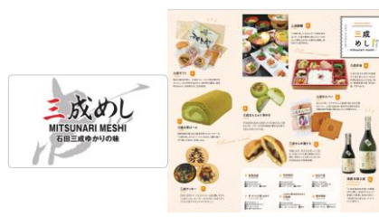
例. 歴史を活用した民間の商品開発・プロモーションの取組み（三成めし）