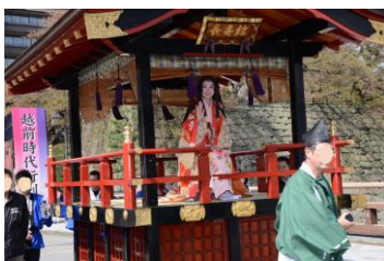
お市の方なりきりフォトスポット

デザイナー等専門家を活用して「美」をテーマとした統一のブランドを立ち上げ「美」に関連した商品・サービスの開発や共同販促・PRを実施