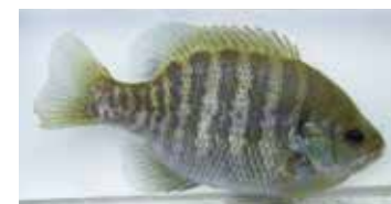
ブルーギル (一財)自然環境研究センター