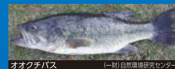
オオクチバス (一財)自然環境研究センター