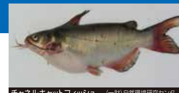
チャネルキャットフィッシュ (一財)自然環境研究センター