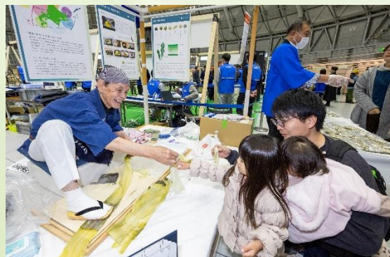
「おぼろ昆布削り」の実演