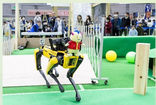
犬型ロボットの操縦体験