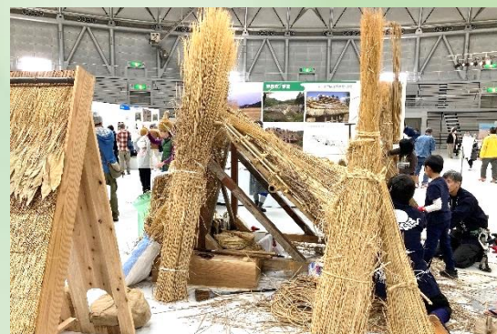
日本の技フェアの様子