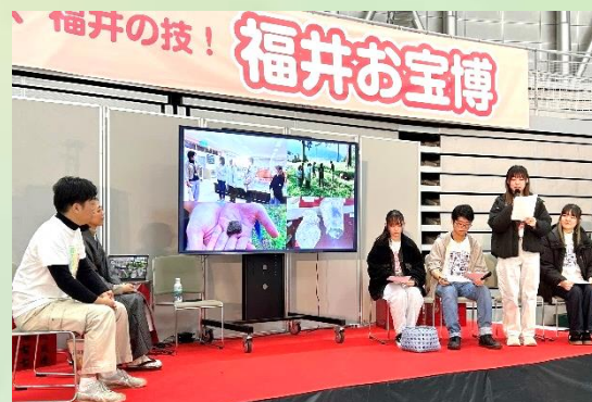
福井大生による発表(三室遺跡の取組み)