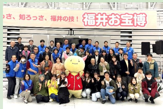
集合写真 出展者の皆様と一緒に