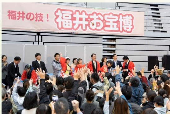
オープニング(まんじゅまき)