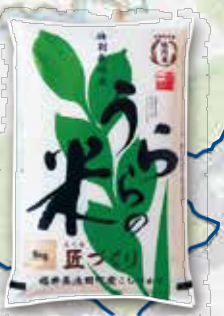
池田町 (うららの米)