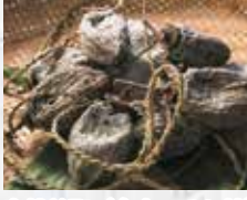
南越前町 (今庄つるし柿)