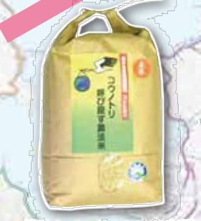
越前市 (コウノトリ農法米)